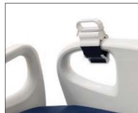
患者ラインマネジメントクリップ