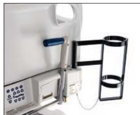
縦型酸素ボンベホルダー