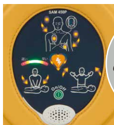
サマリタン PAD 450P 【実機】