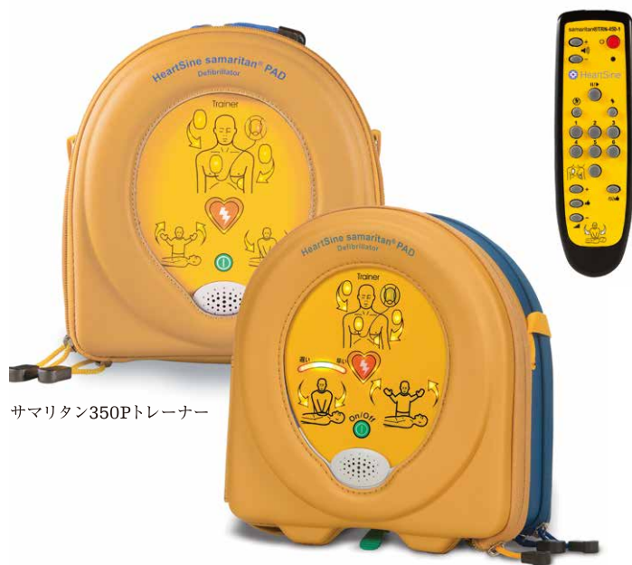
サマリタン350Pトレーナー