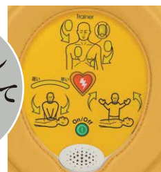
サマリタン PAD 450P 【トレーナー】