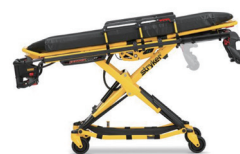
無段階、 最高位105cm・最低位36cm