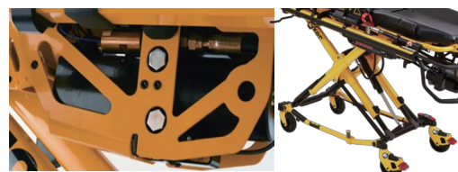
電動油圧昇降システム