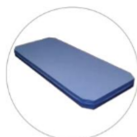
Materasso in schiuma