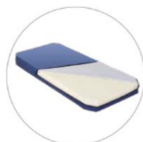
Materasso in schiuma viscoelastica